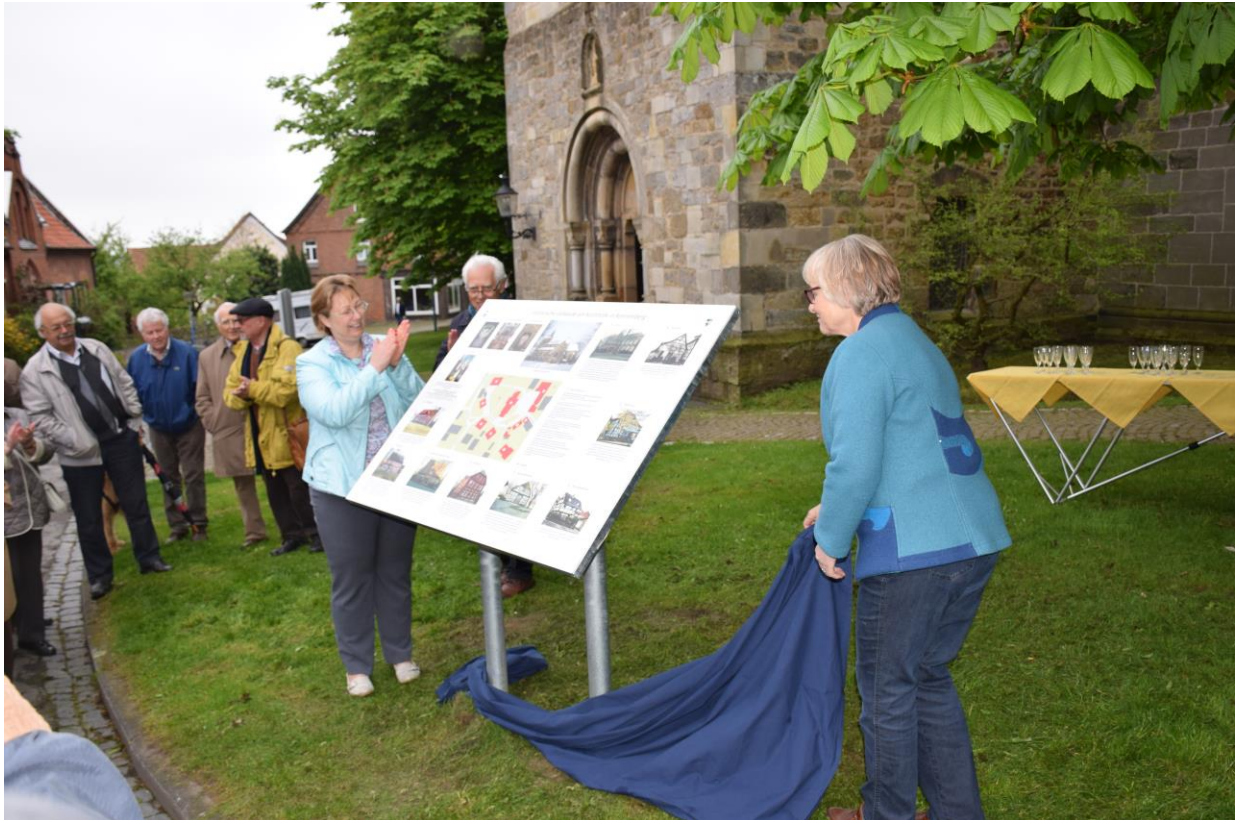
Bei der Einweihung 05. Mai 2017